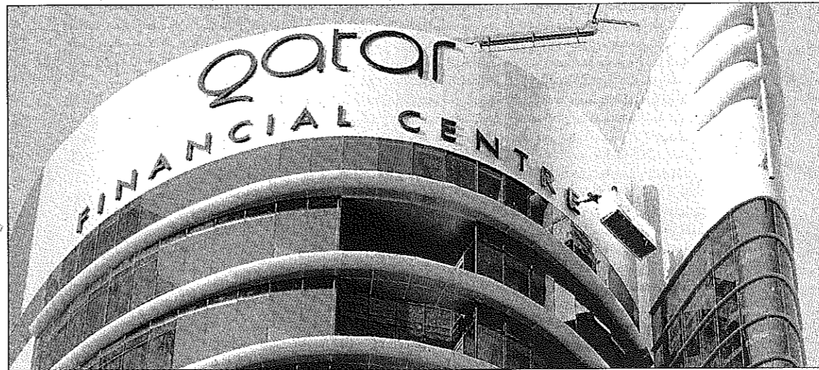
مركز قطر للمال