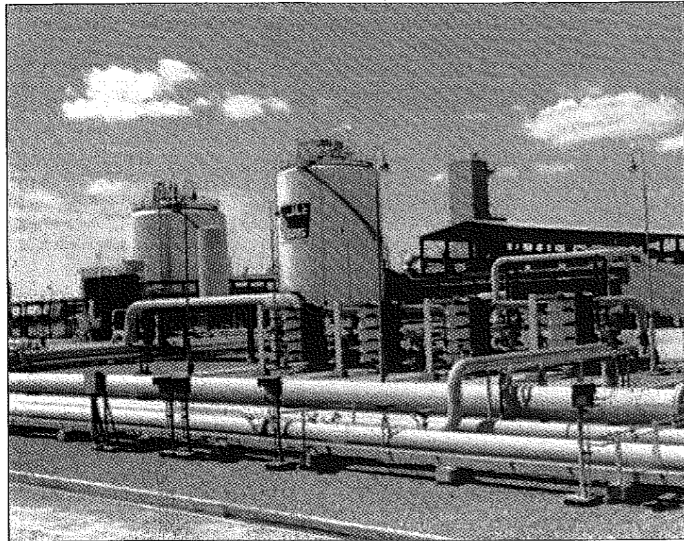
لا تقدم تسريح عمالة